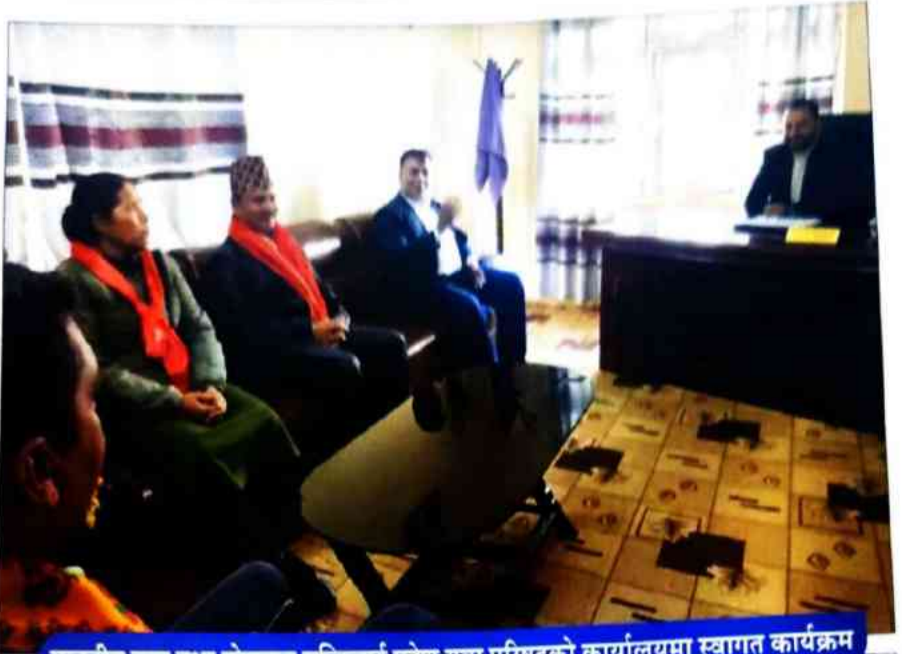
माननीय युवा तथा खेलकुद मन्त्रिलाई प्रदेश युवा परिषद्को कार्यालयमा स्वागत कार्यक्रम