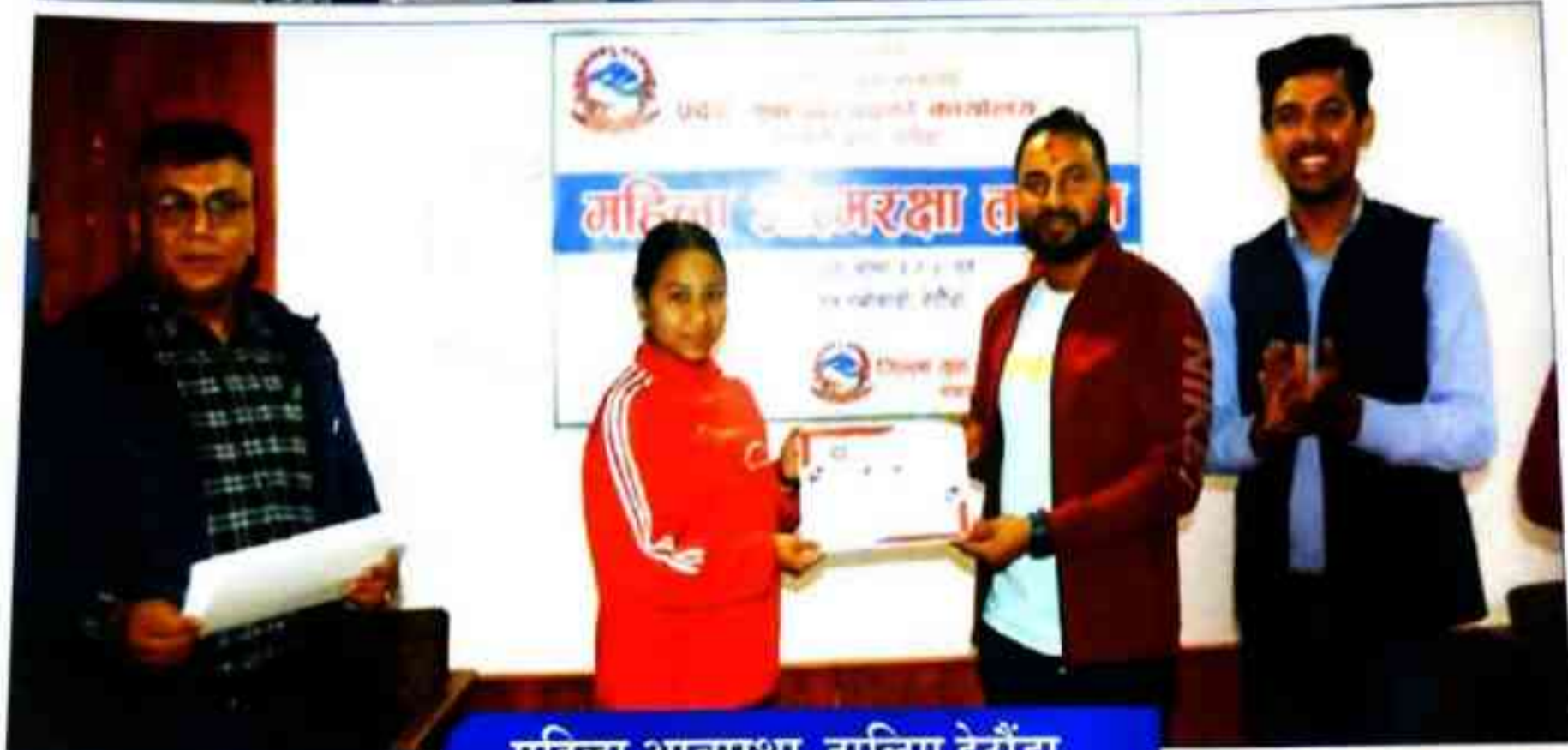
महिला आत्मरक्षा तालिम हेटौंडा