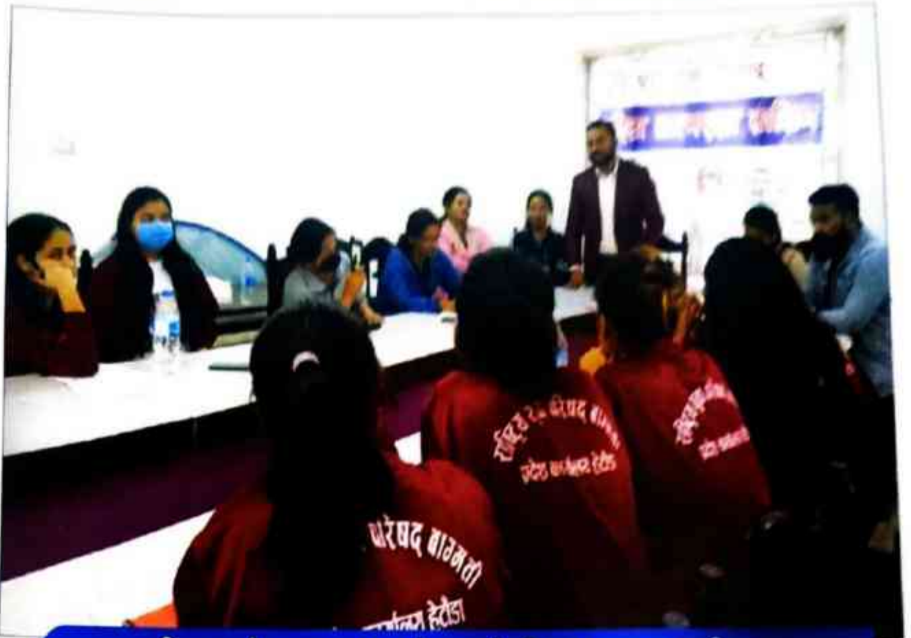
चितवनको भण्डारामा युवतीहरूलाई महिला आत्मरक्षा तालिम

सामाजिक जागरूकताको प्रवर्धन र सशिक्षित कार्यशालाको व्यवस्थापन