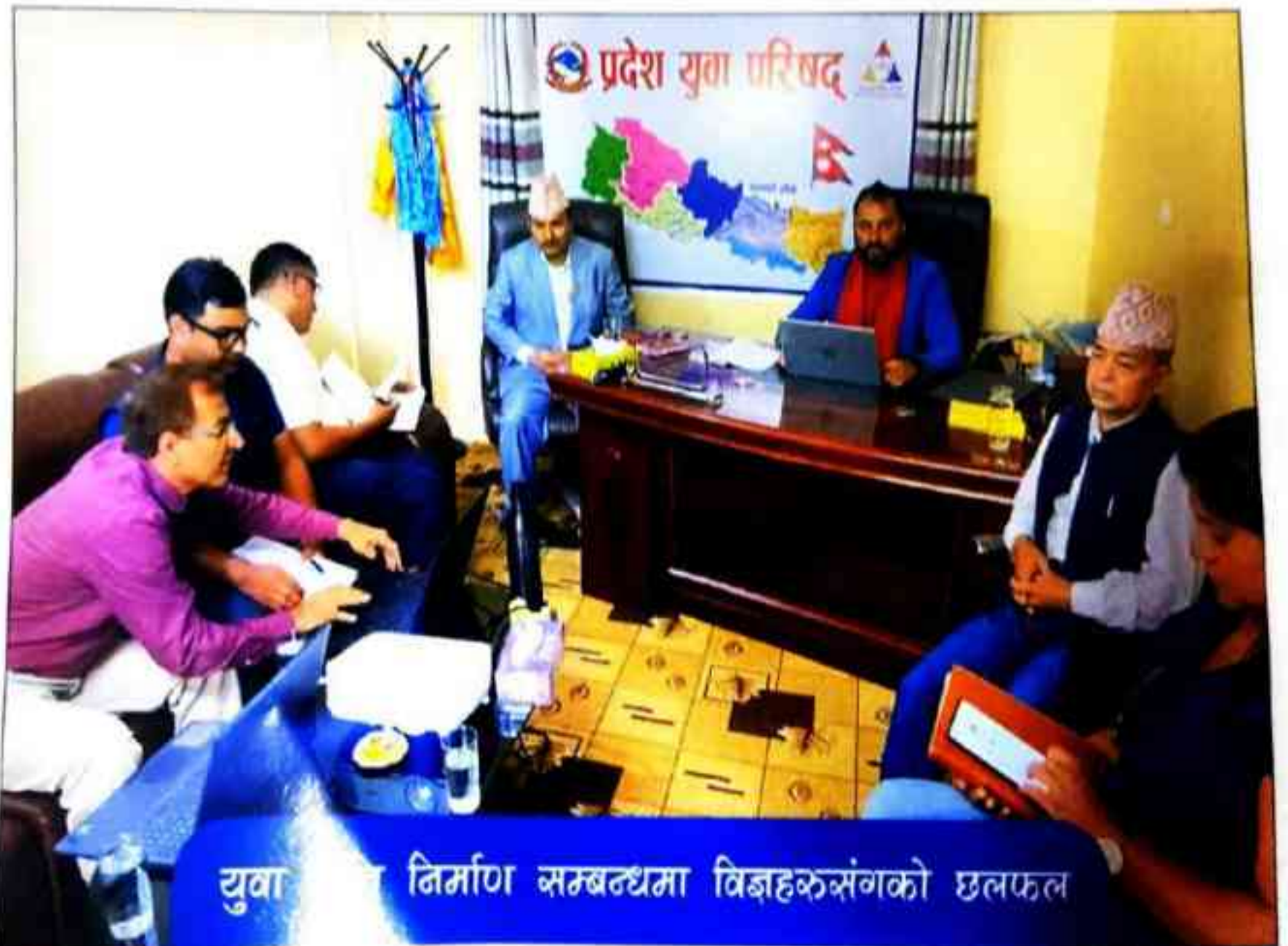
युवा परिषद्को निर्माण सम्बन्धमा विज्ञहरुसंगको छलफल