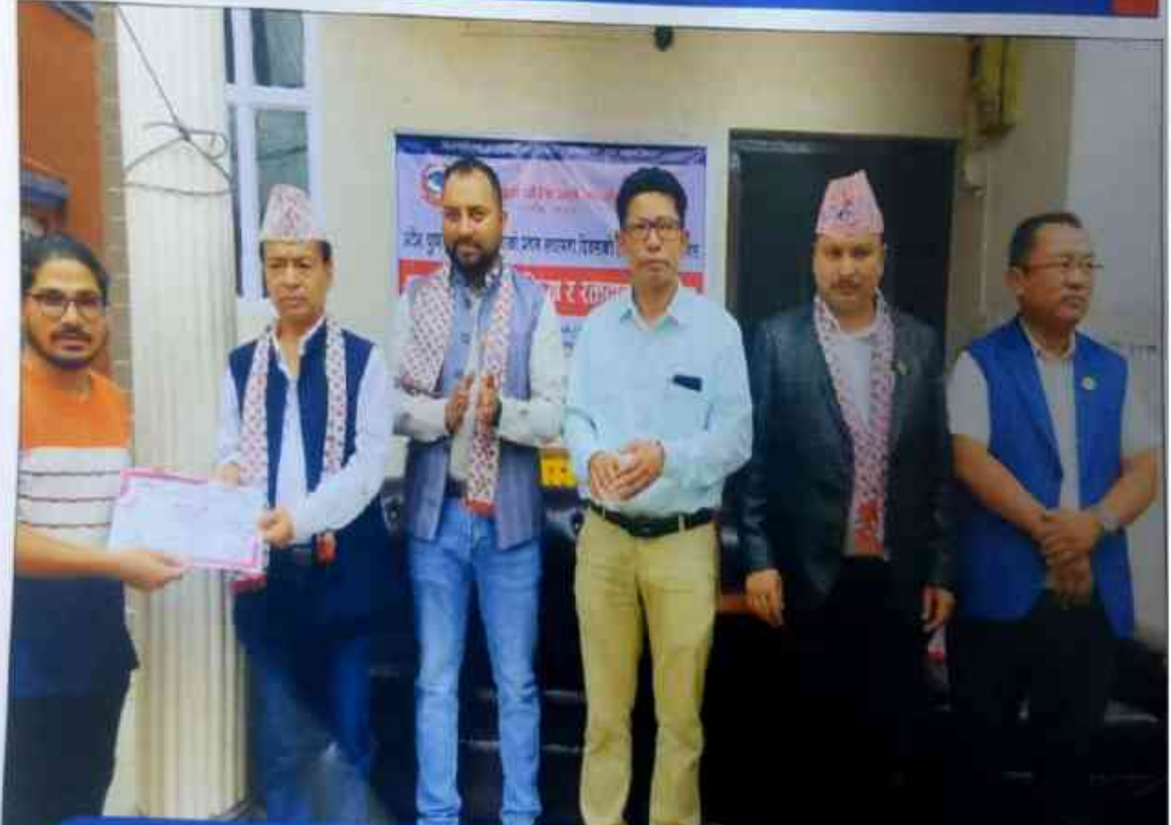
प्रदेश युवा परिषद्को स्थापना दिवसको अवसरमा आयोजित वक्तव्य कार्यक्रम