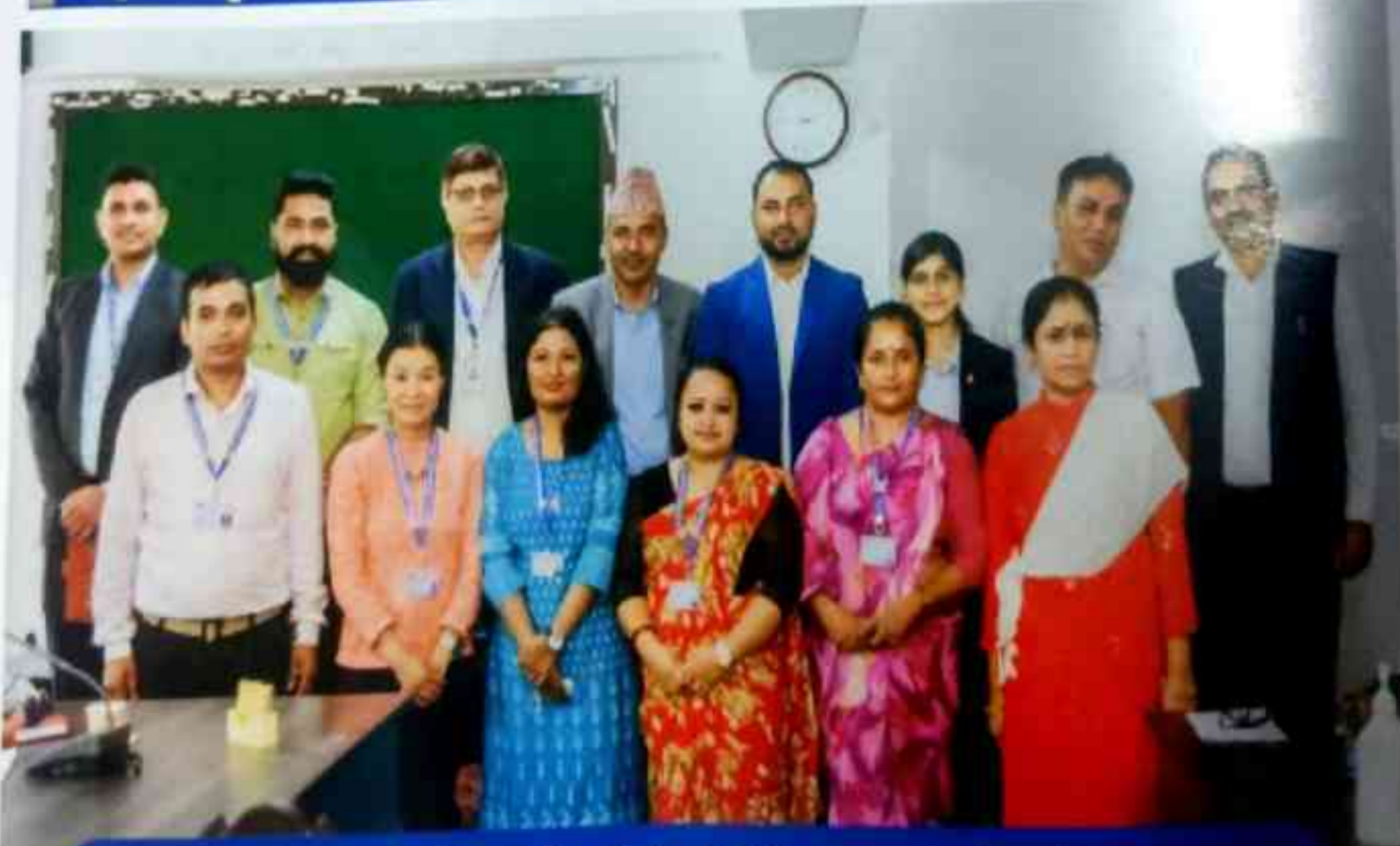
प्रदेश युवा परिषद्को पहिलो बोर्ड बैठक पश्चातको तस्बिर