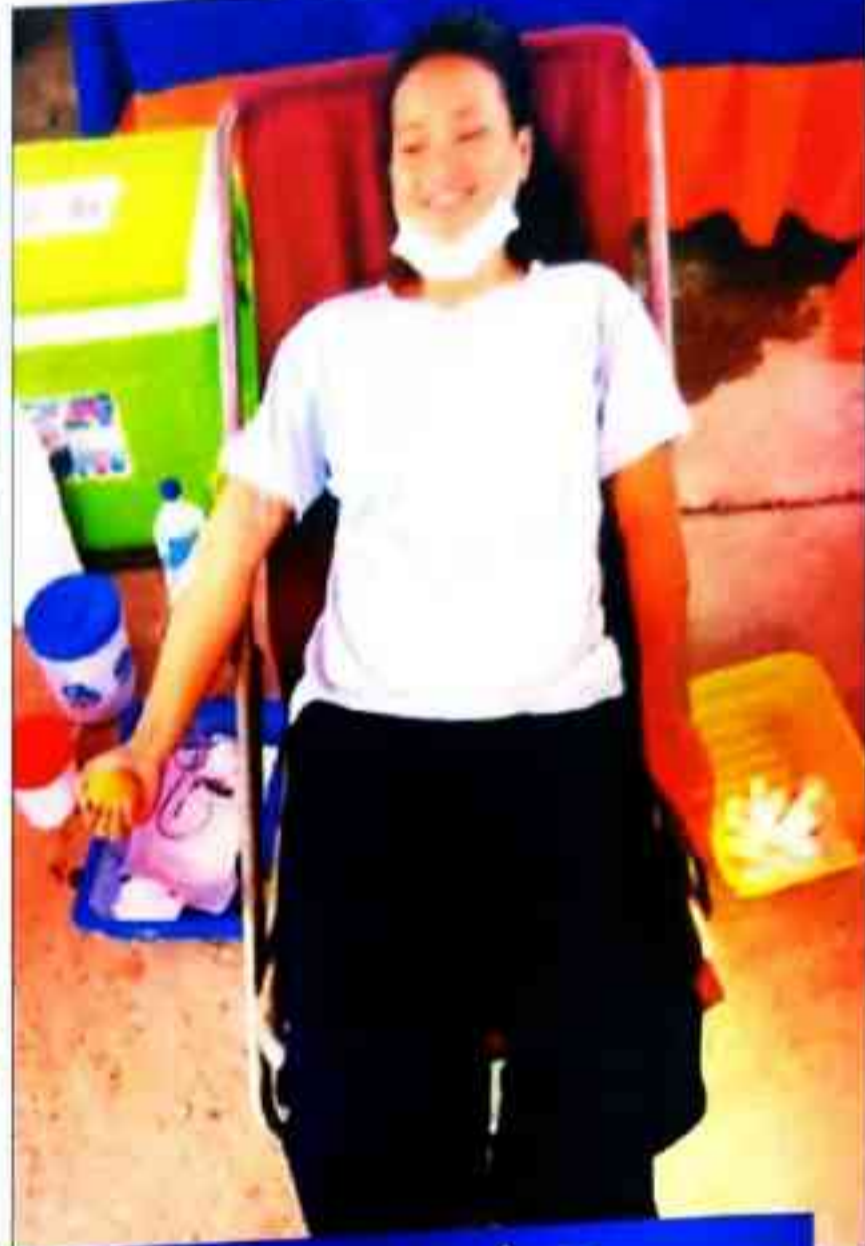
सातौं संविधान दिवसका अवसरमा आयोजित रक्तदान कार्यक्रम