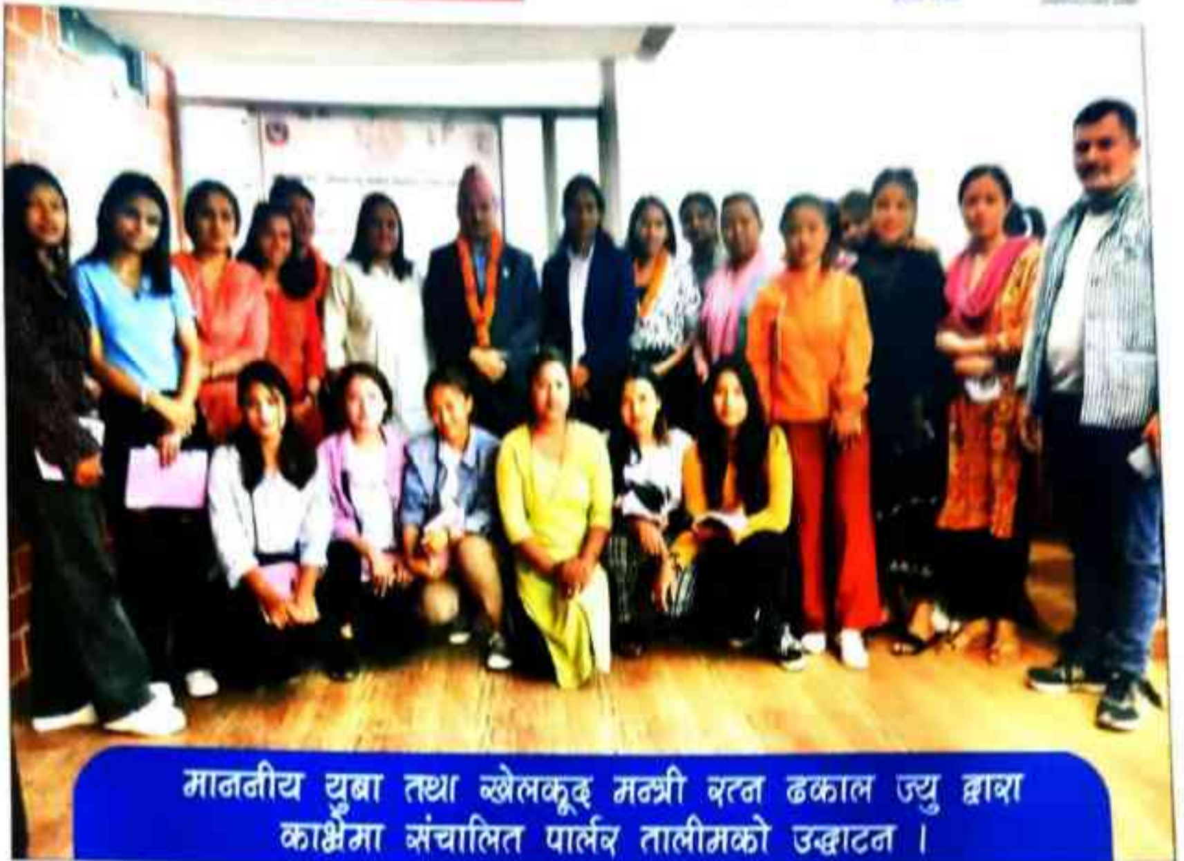
माननीय युवा तथा खेलकूद मन्त्री बदन ढकाल ज्यु द्वारा कार्यमा संचालित पार्लर तालीमको उद्घाटन ।