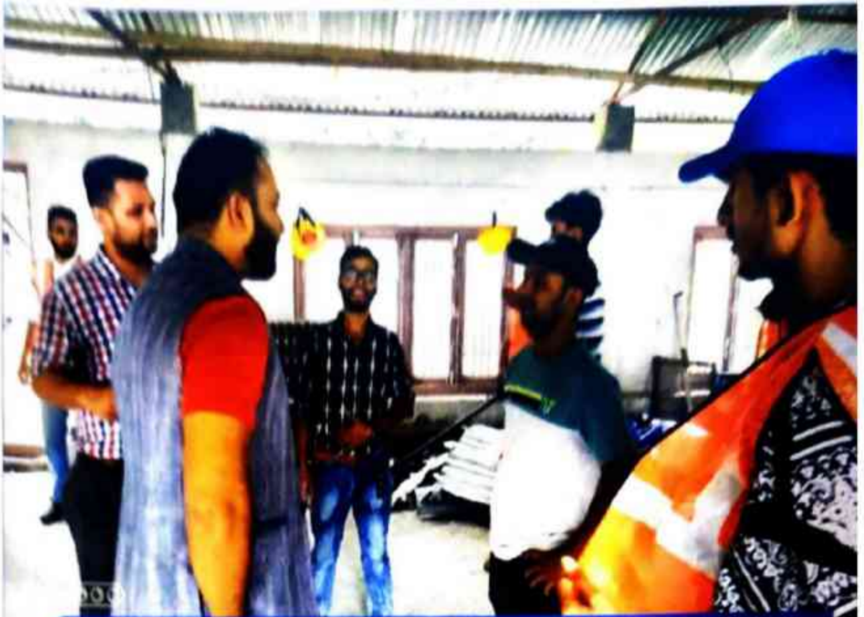
२०७९।०३।०३ गतेका दिन चितवनको माडी नपा मा संचालित ३९० घण्टे पूर्ण रोजगार तालिम पलम्बरको अनुगमनका क्रममा ।