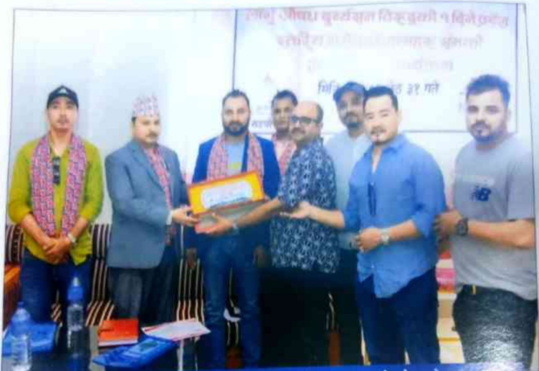
प्रदेश युवा परिषद्, बागमती को सहयोग र रिकभरिङ्ग नेपाल बागमती प्रदेश को समन्वयमा लागु औषध दुर्व्यसन विरुद्ध को एक दिने प्रदेश स्तरीय सरोकारवालाहरु संग को अन्तरक्रिया