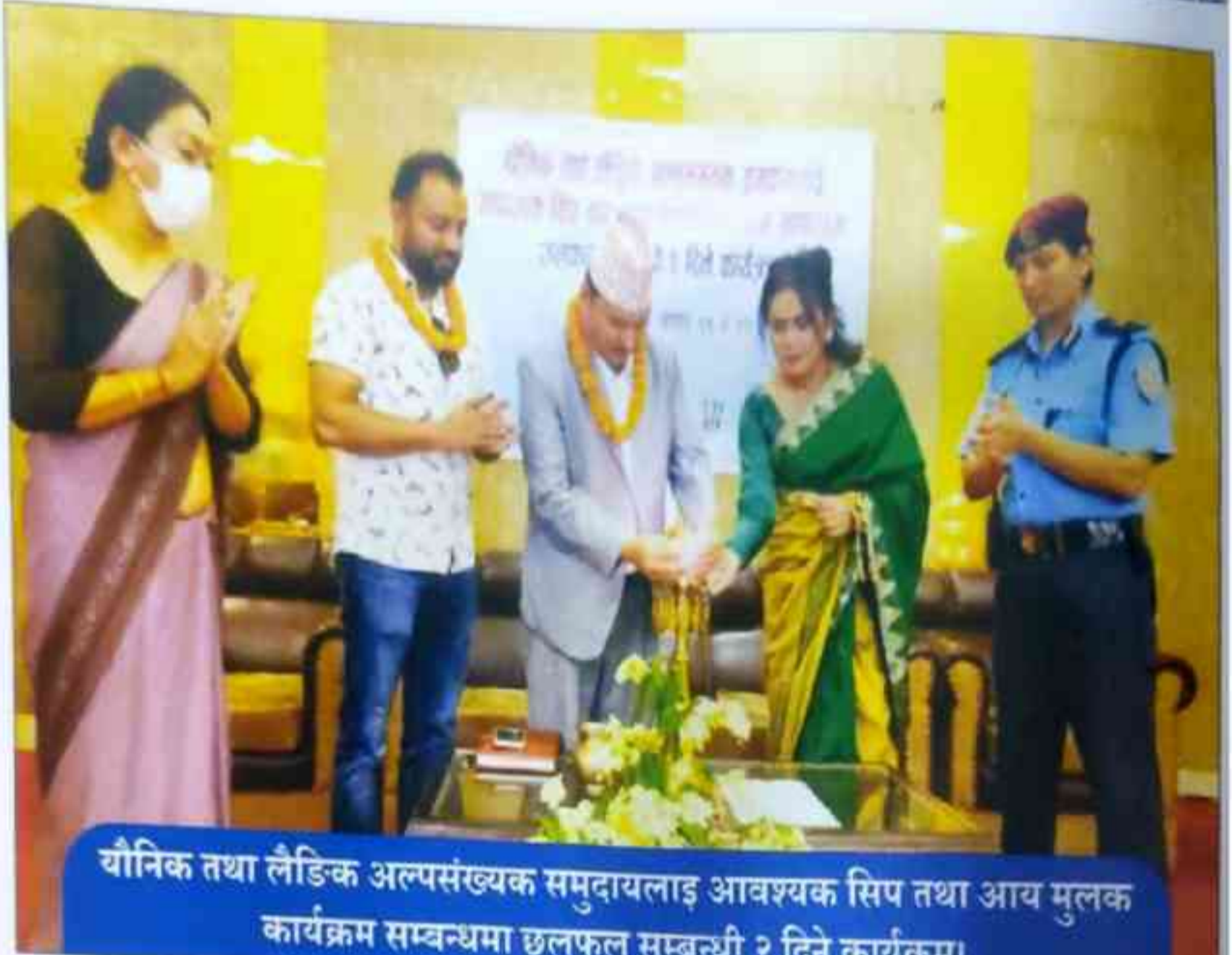
यौनिक तथा लैङ्गिक अल्पसंख्यक समुदायलाइ आवश्यक सिप तथा आय मुलक कार्यक्रम सम्बन्धमा छलफल सम्बन्धी २ दिने कार्यक्रम।