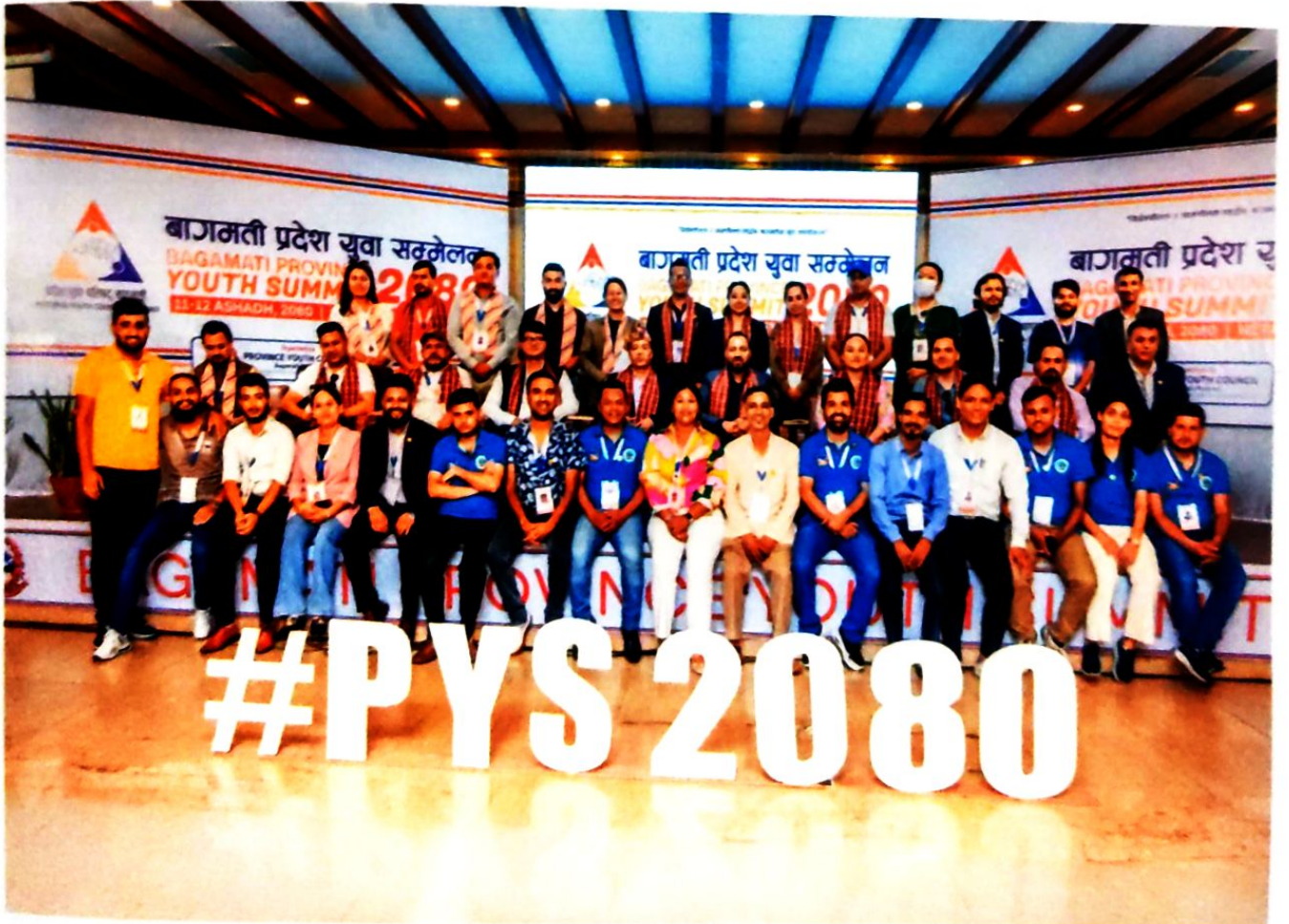
Group photo at Closing Ceremony of Bagmati Province Youth Summit 2080